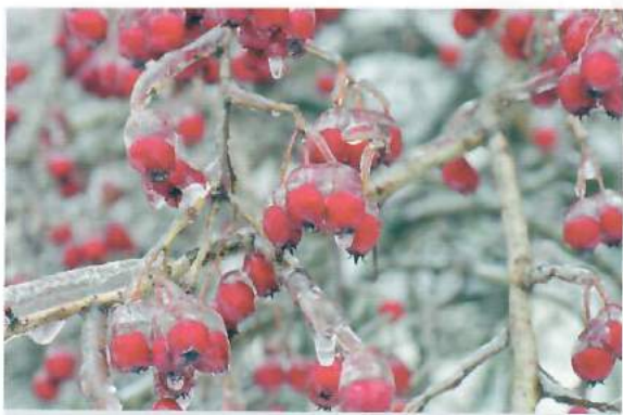
Все долги перед фондами лучше погасить еще в декабре. Ведь с 2017 г. неуплаченная недоимка по взносам будет чревата заморозкой ваших банковских счетов

такую переплату можете только зачесть в счет будущих пенсионных платежей (например, декабрьских) 31 . Вернуть на счет ее нельзя.